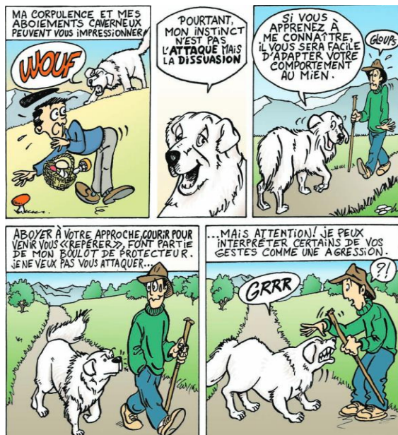
Extrait du livret « Face aux chiens de protection, quelques réflexes à adopter » édité par la DREAL Midi-Pyrénées en partenariat avec la Pastorale Pyrénéenne (2014) (13)

être apposé sur les panneaux « classiques » signalant la présence des troupeaux et renvoyer à l'une de ces vidéos que l'utilisateur pourrait ainsi consulter sur son téléphone portable avant de s'engager sur le sentier.