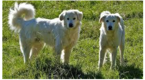
Montagnes des Pyrénées (dits « patous »). Photo libre de droit