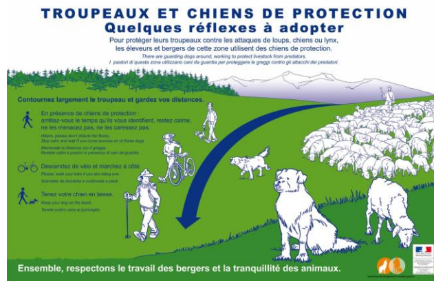
Panneaux indiquant le rôle tenu par les chiens de protection et l'attitude à adopter vis-à-vis d'eux (Ministère de la transition écologique / ministère de l'agriculture et de l'alimentation)

comportements à adopter pour éviter de surprendre les chiens de protection. Elle ne doit être pas alarmante mais souligner le rôle probant du chien de protection pour l'élevage itinérant.