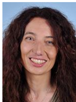
Mme Bénédicte Taurine Députée Rapporteuse

Créé le 9 octobre 2019 au sein de la commission des affaires économiques, le groupe de travail a consacré quatre mois à établir un bilan de l'efficacité et des difficultés générées par l'utilisation des chiens de troupeaux . Le travail a porté essentiellement sur les chiens de protection des troupeaux, les chiens de conduite ne suscitant pas de problèmes particuliers.