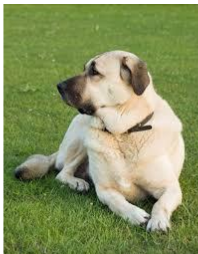
Berger d'Anatolie, dit « Kangal » (photo libre de droit)

Organiser une filière, afin de cadrer le suivi génétique strict et la rationalisation des accouplements dans le but de sélectionner les chiens les plus aptes au travail et d'écartier les chiens potentiellement dangereux paraît indispensable ( proposition n° 1.2 ).